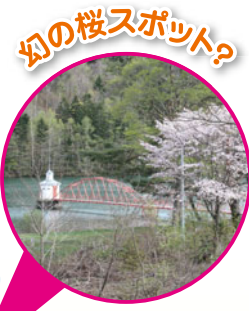
ハートに見えるかな?

ロープウェイ山頂駅の近くにある一本桜は「天狗桜」と呼ばれ、小樽市内では桜前線のフィナーレを飾る最終ランナーです。老木ですが毎年見事な花をつけ、小樽市民にとっても愛され大切にされています。満開の天狗桜は、ある角度からみるとピンクのハートの形に見えます! ハートの天狗桜に出会えたら、絶対いいことありそうですね♪